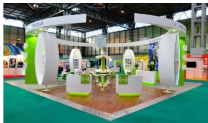
Образец фриза со страховкой