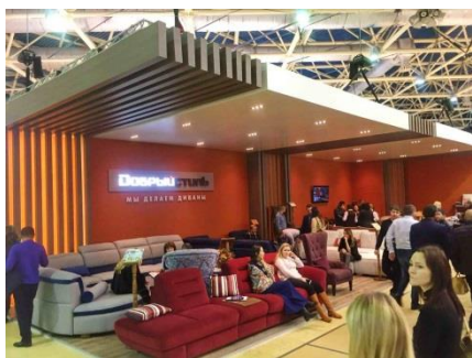
Образец стены под покраску