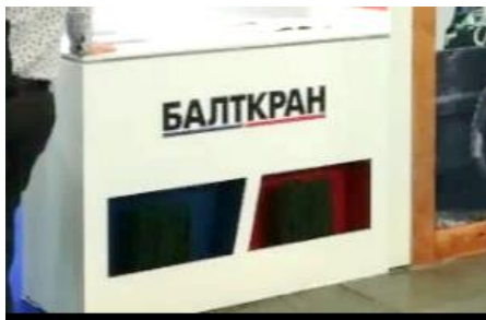
Образец стола ресепшн - покраска